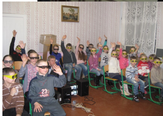
Фільм в 3D форматі